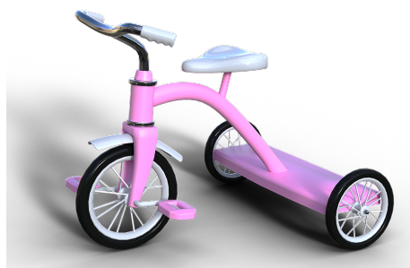
Figure 2: Le tricycle

Si on revient sur ton expérimentation de la grande roue, les pédales étaient directement sur la roue avant. Imagine-toi donc que même en ajoutant le système de chaîne et roues dentées, on a toujours un problème quand on arrête de pédaler. Sais-tu lequel? Rappelle-toi ton tricycle (Figure 2).