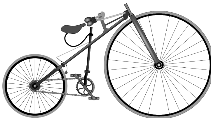
Bicyclette de Lawson

Si tu retournes aux images de l'histoire de l'évolution du vélo, en 1879 , on voit qu'on a conservé la grande roue, mais que constates-tu sur l'emplacement des pédales? (Figure 3)