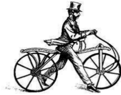
Figure 1: Image du vélocipède.