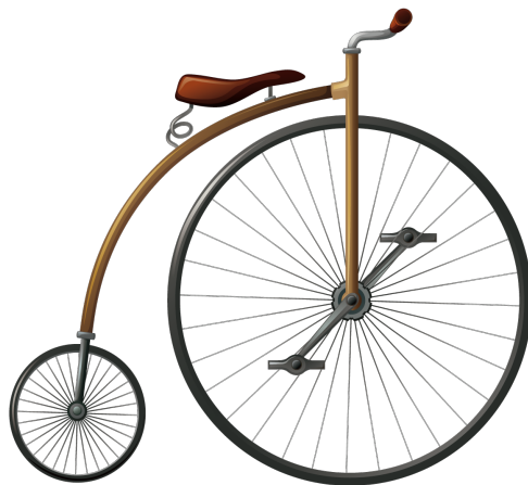
Figure 2: Le Grand-Bi