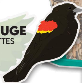
CAROUGE À ÉPAULETTES