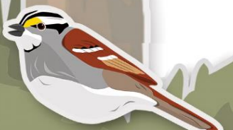
BRUANT À GORGE BLANCHE